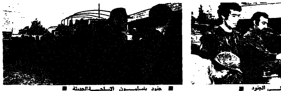
جنود يسلمون الأسلحة الحديثة